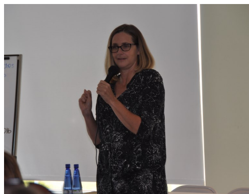
Madame Sylvie Fréchette