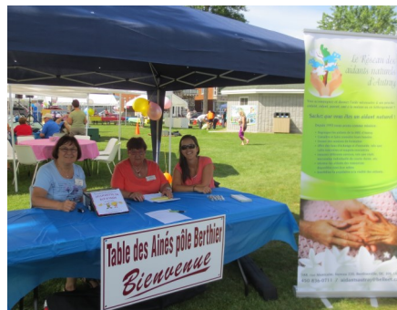
Épluchette de blé d'inde de la table des aînés