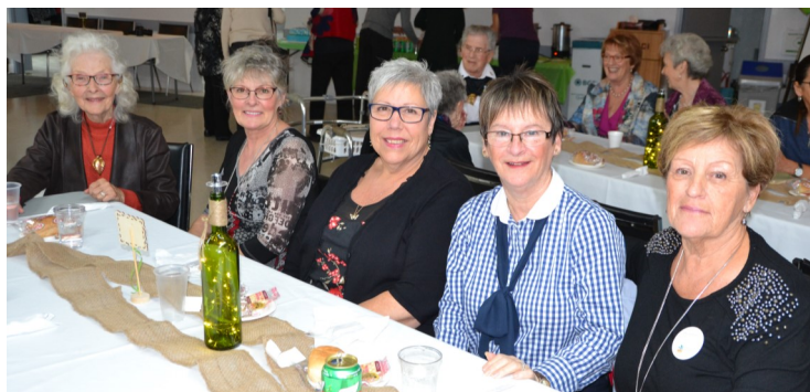
Nos membres du secteur de Berthierville