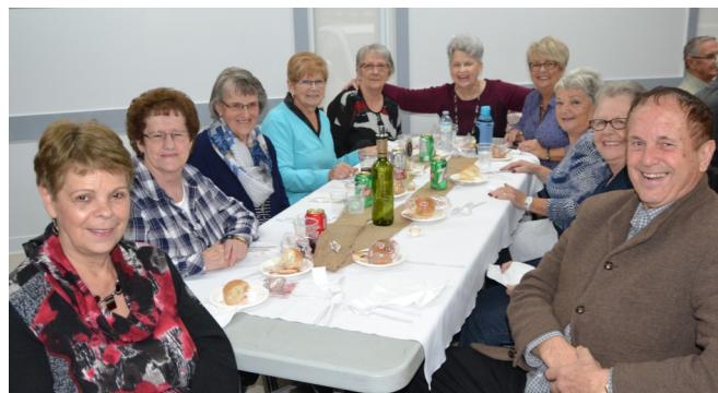
Une table de nos membres provenant de Lavaltrie