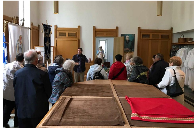
Une visite très intéressante.