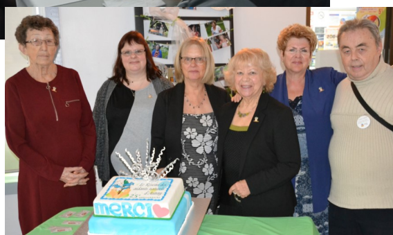
Le conseil d'administration 2018-2019.