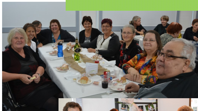
De beaux sourires!